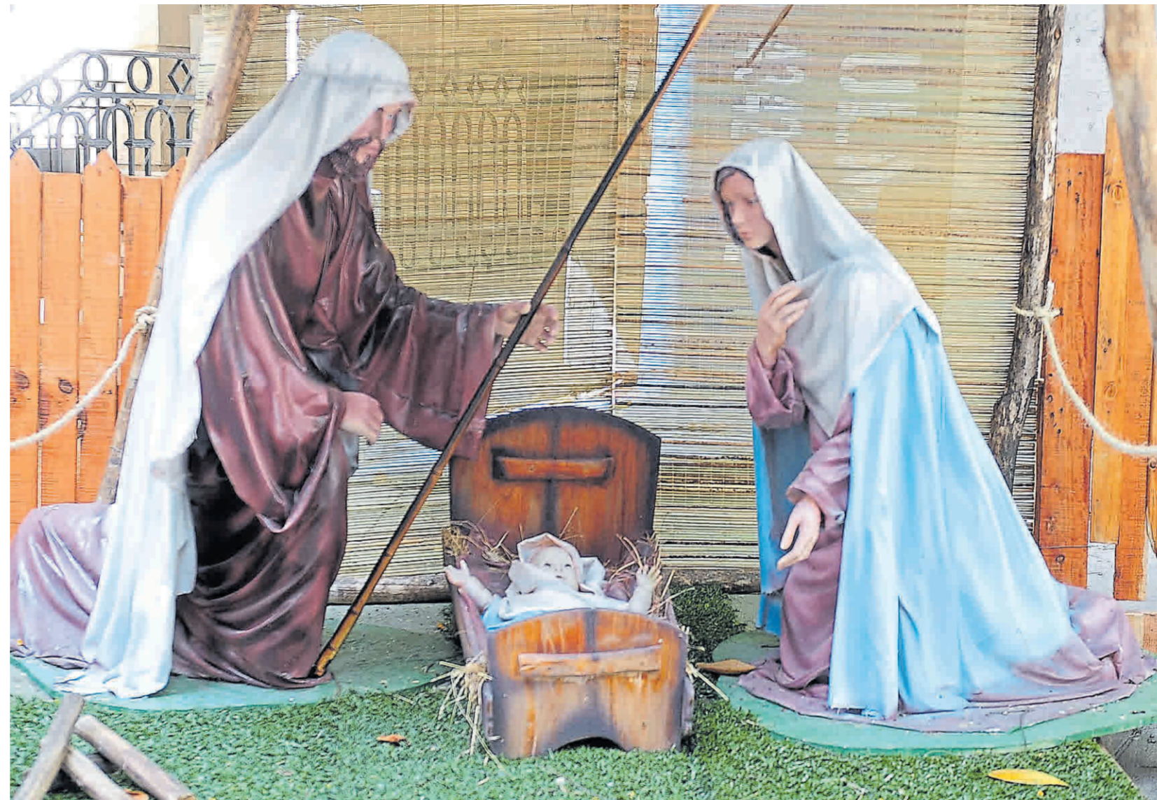
Muchas representaciones, un mismo sentido. La elocuencia del pesebre que todos los años se arma en la sede de la Conferencia Episcopal Argentina.

Surgieron representaciones del nacimiento con fondos de cartón pintado y recortado, edificios o grutas de madera, cartapesta o papel maché. Más tarde, estas fueron puestas dentro de nichos, vidrieras, fanales o globos de cristal. Con su estilización, el ícono de la humildad devenido en adorno ostentoso y empezó a ocupar