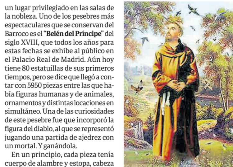
San Francisco de Asís. Le dio un renovado impulso al pesebre.

El pesebre se hizo popular cuando se lo empezó a armar en los hogares y se volvió imprescindible para celebrar la Navidad en familia. La costumbre se arraigó en nuestro país durante el virreinato. Los había de madera, cera y yeso y suscitaba el entusiasmo popular aunque, por supues-