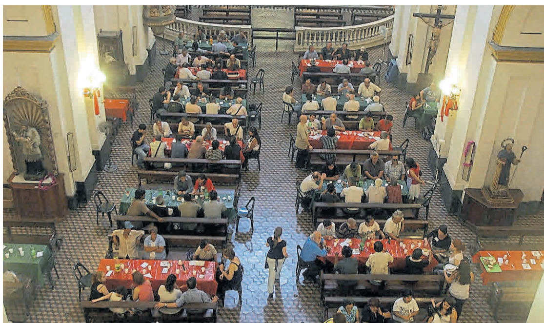
Almuerzos navideños. La Comunidad Sant'Egidio recibe a personas en situación de calle en iglesias.

Almuerzos de Navidad La Comunidad de Sant'Egidio , como todos los años, prepara una Navidad fraterna para aquellos deambulantes, ancianos, niños, adolescentes y familias solas. El 25 de diciembre, los almuerzos se brindarán en los templos de María Madre de la Iglesia (Caballito), Nuestra Señora de las Victorias (Retiro), San Pedro González Telmo (San Telmo), San Ildefonso (Palermo) y San Pedro (La Boca). En el conurbano, en Virgen de las Gracias (Villa Martelli), Catedral de San Justo, Catedral de Gregorio de Laferrere, Hogar Abuelo's House (Lanús), Hogar Marín (San Isidro). También en la cárcel de Devoto y en la Iglesia Virgen de Caacupé de la Villa 21.