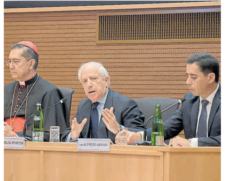
Expositores. El cardenal Ayuso, el embajador y el secretario de Culto.