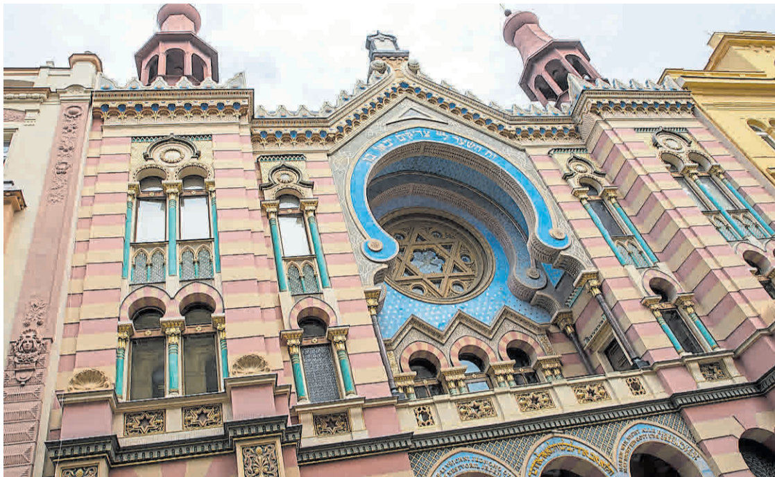
La Sinagoga del Jubileo. En Praga, la Asociación Israelita escogió el nombre que debía llevar el templo.

Una de las razones que explican la elección de esta modalidad islámica es que se trata de un arte que no privilegia la ornamentación figurativa y es afín a la concepción judía. Pero el esplendor de la arquitectura islámica desplegado en las sinagogas tiene un mensaje subliminal. Y es aquel que indica que los judíos han formado parte esencial y activa de la civilización islámica y pueden proveer parámetros para una nueva y abierta civilización mundial basada en las dife-