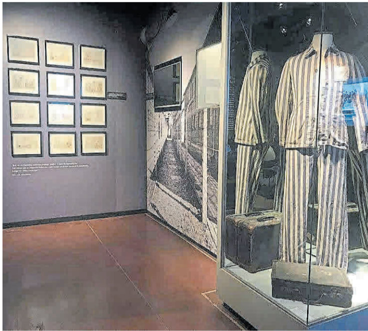
Estremecedora. La muestra incluye ropa de los campos de exterminio.

Según las autoridades, la muestra cuenta con herramientas pedagógicas y tecnológicas de última generación y está a la altura de los museos