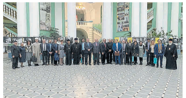
Intercambio. Los asistentes al encuentro en la Universidad de Moscú.

El IDI seguirá con su tarea a nivel internacional. Así, la ejemplar convivencia interreligiosa en el país se convierte en un logro “de exportación”.