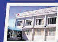
HOTEL "EVA PERÓN" San Clemente del Tuyú