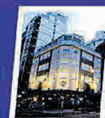
HOTEL S.U.T.E.C.B.A. Mar del Plata