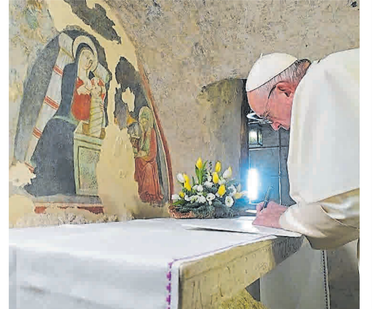
La "cuna" del pesebre. El Papa durante su reciente visita a Greccio.

Francisco recupera el sentido profundo de la costumbre de "armar el pesebre": "El belén forma parte del dulce y exigente proceso de transmisión de la fe. Comenzando desde la infancia y luego en cada etapa de la vida, nos educa a contemplar a Jesús, a sentir el amor de Dios por nosotros, a creer que Dios está con nosotros y