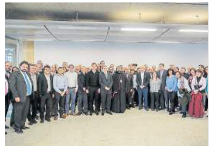
Almuerzo anual. Los religiosos con el jefe de Gobierno porteño.

El C40 esta compuesto por alcaldes de 100 ciudades líderes.