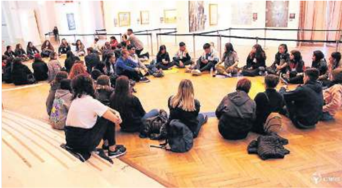
Encuentro. Más de 25.000 chicos de distintos países ya han realizado la experiencia "Scholas Ciudadanía".

Durante seis días, 400 jóvenes investigaron y crearon estrategias para combatir el suicidio y la agresión.