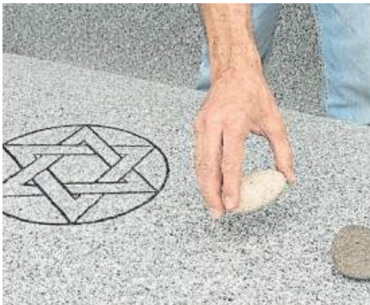
Yortzait. Es costumbre dejar piedras en lugar de flores en las tumbas.

Al retornar del sepelio comienza el período de Shivá (siete), los siete días de un luto intenso. En ellos, los deudos permanecen en el hogar, sentados en el suelo, lugar en donde des-