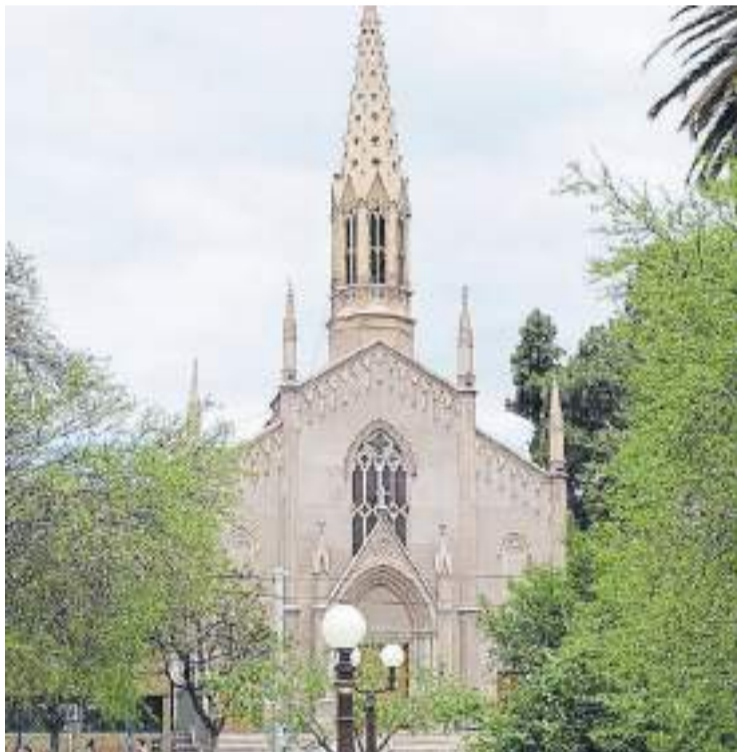
Pionera. La iglesia tiene mobiliario reciclado y propuestas ecológicas.

La declaración de bien patrimonial se basa en que bajo la gestión de su párroco, el padre Horacio Day, desde 2021, marca la diferencia en aspectos ambientales, cambiando la lumina-