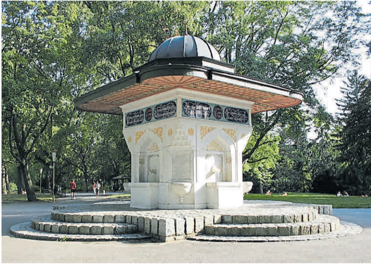
Fuente de Yunus Emré. Por el 750 aniversario de su nacimiento (Viena).

Algunos de sus poemas hablan con elocuencia de convivencia, humanismo y universalismo: «Nuestro único enemigo/es el resentimiento./ No guardemos ren-