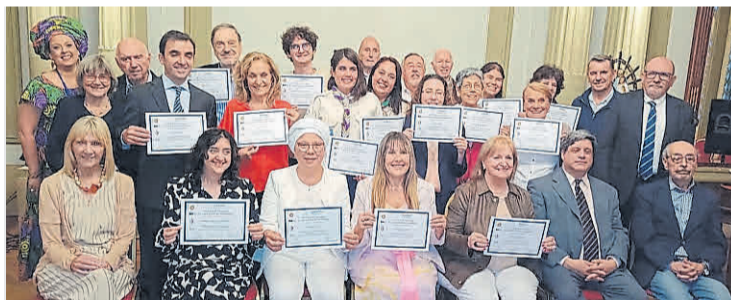
Egresados. Curso de Formación en Diálogo Interreligioso (4ta. edición).