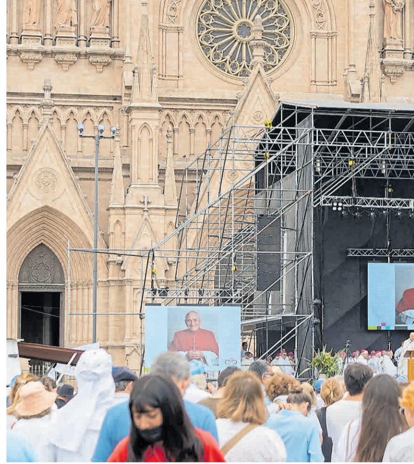
Beatificación. Muchos de los que conocieron a Pironio participaron emocionados