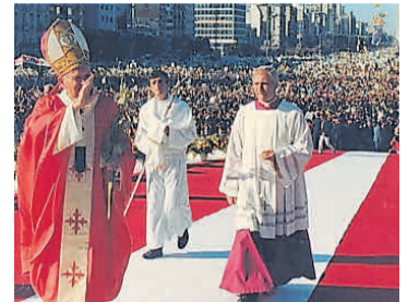
JM.J. Juan Pablo en Buenos Aires.

Eduardo Francisco Pironio nace el 3 de diciembre de 1920 en la ciudad de Nueve de Julio, provincia de Buenos Aires. Sus padres eran de origen italiano, del Friuli, región del Norte lindante con la actual Eslovenia. Último hijo de una familia de 22 hermanos, la madre era muy devota de la Virgen de Lujan. Esta devoción mariana el futuro beato la vivió con gran ardor durante toda su vida. De hecho, fue ordenado sacerdote el 5 diciembre de 1943, a los 23 años, en la basilica y quiso que lo sepultaran allí. Entre 1953 y 1958 vivió un tiempo de profundización de sus estudios teológicos en Roma. En 1958 fue nombrado vicario general de la diócesis de Mercedes y en 1960, rector del Seminario Metropolitano. Durante el Concilio Vaticano II, siendo decano de la facultad de Teología de la UCA, fue perito en el Concilio Vaticano II. Transmitió su profundo amor para las enseñanzas conciliares a diferentes generaciones de sacerdotes. En 1967 fue nombrado por Pablo VI primer administrador apostólico de la diócesis de Avellaneda y luego, secretario general del CELAM, del que será también presidente, aportando reformas al organismo de obispos. En 1968, vivió con entusiasmo conciliar la asamblea episcopal de Medellín en 1968, que consagró “la opción preferencial para los pobres”. Su teología de la liberación tiene un profundo rasgo evangélico y en los