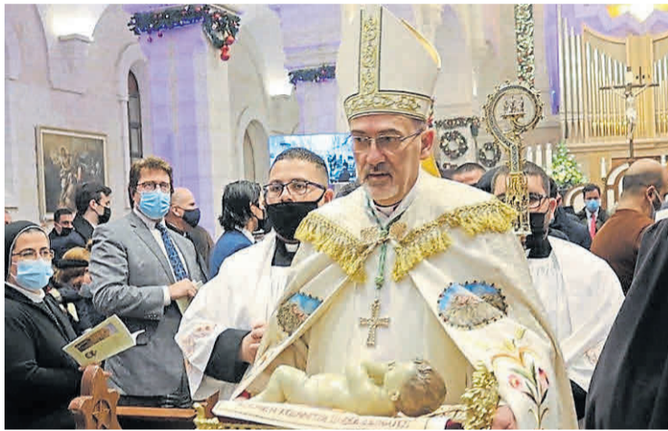
Otra Navidad. El patriarca latino en la celebración del año pasado.

Los patriarcas y líderes de las Iglesias de Jerusalén decidieron este año que en la ciudad de Belén no se instalara, como es costumbre, el gigantesco árbol navideño ni se encenderán sus luces de colores e invitaron a sus sacerdotes y fieles a