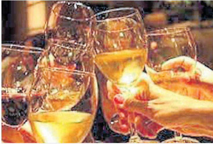
Moderación. Hay escritos que previenen sobre sus efectos negativos.

Más de 300 veces el texto bíblico emplea la palabra vino - Yayin - o el fruto de la vid - Pri Hagafen . No obstante, hay otros escritos que nos