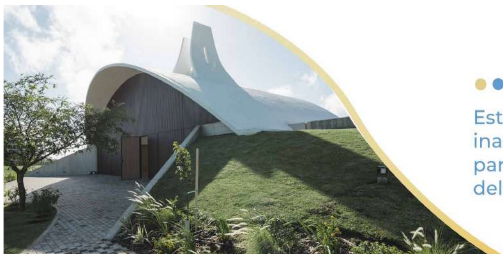
Imagen Asuntos públicos Comunicación digital Prensa Eventos Manejo de crisis

ESPACIO DE DIÁLOGO INTERRELIGIOSO UNA MIRADA QUE TRASCIENDE