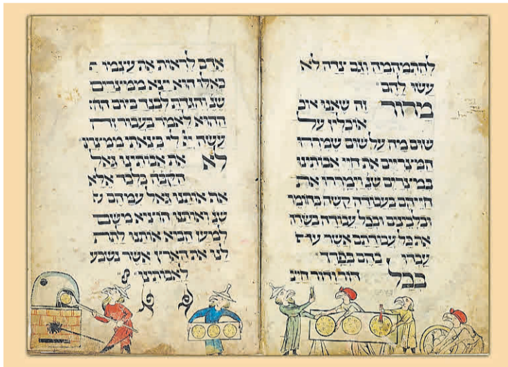
La Hagadá Cabeza de Pájaro. Una de las más antiguas y bellas.

El contenido propio de la Hagadá data del siglo V a.C. y continuó gestándose hasta el siglo IV d.C. La estructura que posee, tal como la conocemos hoy, quedó ensamblada en el siglo X. Pero es recién en el siglo XIII cuando la Hagadá fue escrita como libro independiente y se convirtió en uno de los más populares del