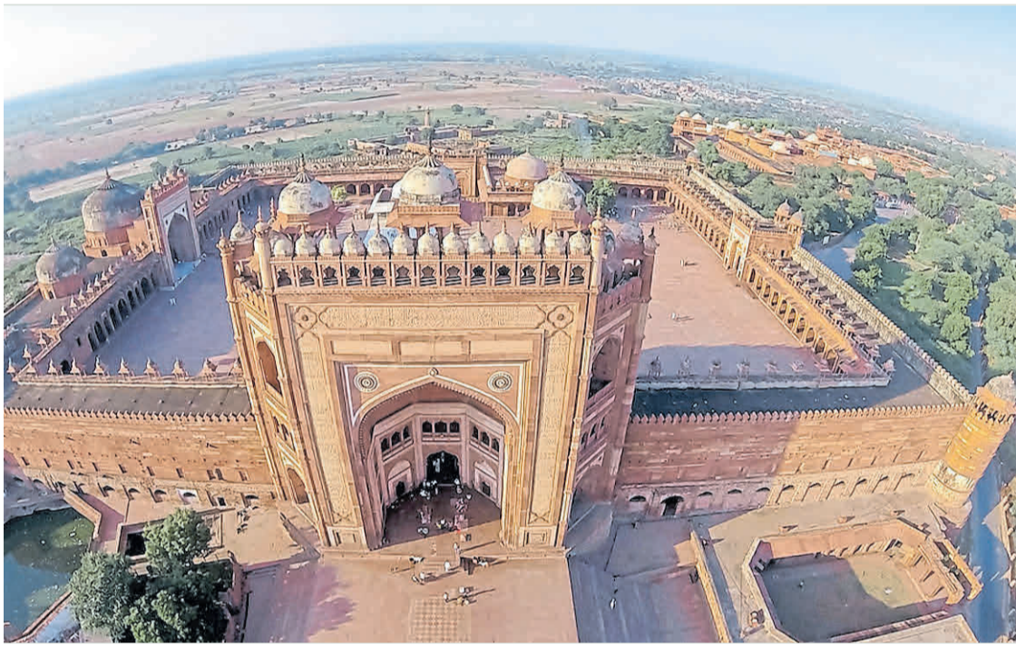
Fatehpur Sikri (India). "Pórtico de la Magnificencia" en la Gran Mezquita del Viernes.

Desafiando los rigores del tiempo, con sus cuatro siglos y medio, este lugar es hoy el más extraordinario de los museos al aire libre del mundo.