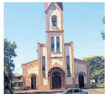
Parroquia. San Pedro y San Pablo.

La fundación tiene además una dimensión educativa recibiendo escuelas y centros educativos de todos los niveles con participación de jóvenes y docentes. Como objetivo de su misión se encuentran la promoción, investigación y educación acerca de las causas y consecuencias propias de la problemática de la “situación de calle” para intentar transformarla.