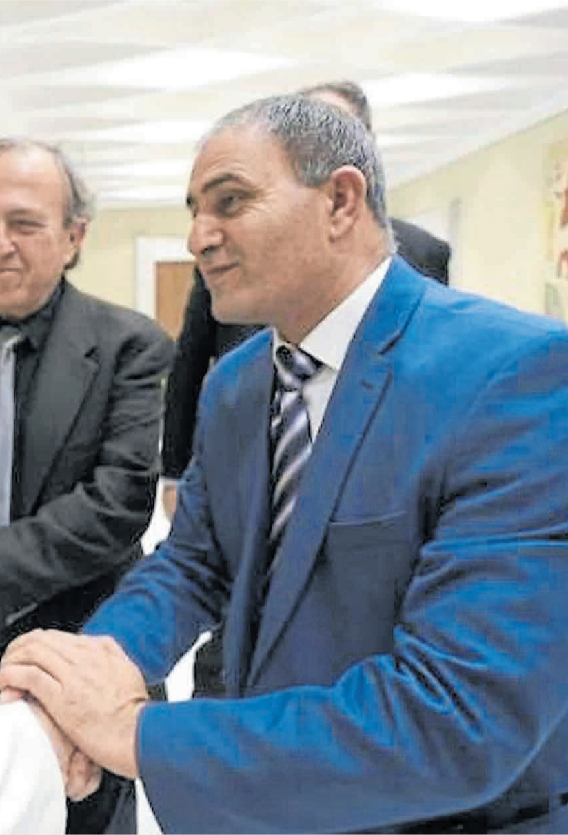
apa. Pensaban que sólo lo saludarían en la multitudinaria Audiencia General.

gos, sino que somos hermanos. Nuestra amistad va más allá de cualquier conflicto. Además, le hemos pedido que rece por la paz entre israelíes y palestinos”.