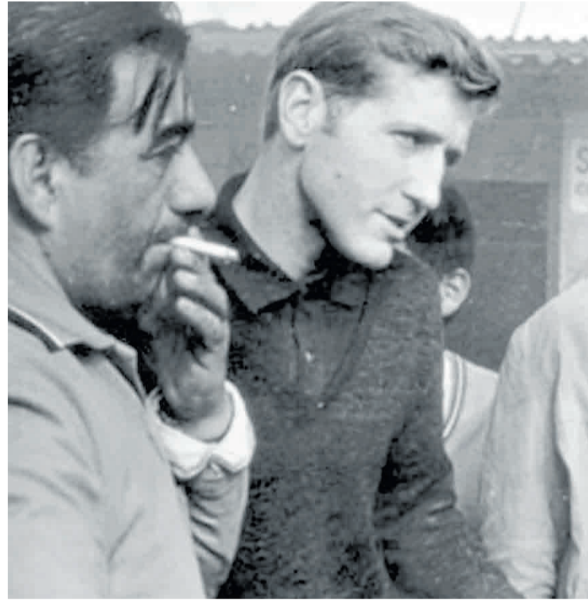
Un sacerdote muy querido en las barriadas populares. El padre Mugica con ve...

Con la vuelta a la democracia, en 1973, les recriminó a los líderes montoneros seguir con la violencia, particularmente desde el ase-