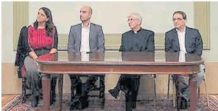
Apertura. Autoridades del GBA y de Valores Religiosos en el inicio.

Auspiciado por el Gobierno de la Ciudad a través de la Dirección Ge-