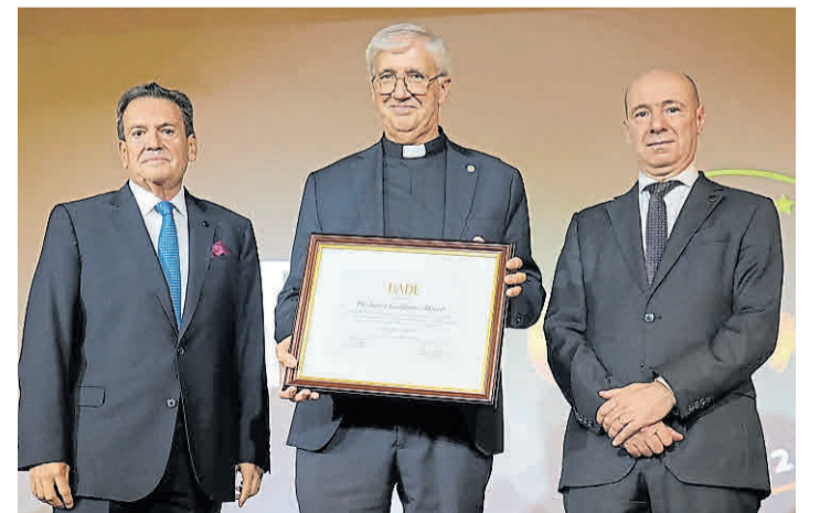
Entrega. Marcó lo con el presidente honorario y el rector de UADE..

"Solo me falta agradecer a Dios que es el que me permite mantener un ideal de vida y a la Iglesia, en la persona del Papa Francisco, que me regaló la posibilidad de desarrollar talentos y confió en mí", completó el sacerdote.