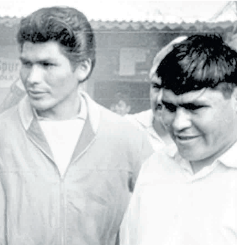
cinos de la Villa 31 de Retiro que levantaron allí la capilla Cristo Obrero.

bor religiosa porque consideraba que, ante todo, era un sacerdote. La base de su ministerio sacerdotal fue la Villa 31 de Retiro, donde fundó la capilla Cristo Obrero , levantada por los brazos de los vecinos. Y aunque no faltaron las tensiones con sus superiores por la ambigüedad ante la violencia y su partidización, quiso estar siempre dentro de la Iglesia. Obediente a su arzobispo -que era por entonces monseñor Juan Carlos Aramburu- rechazó una candidatura a diputado. Además, a diferencia de muchos de los sacerdotes del Movimiento para el Tercer Mundo que bregaban por el celibato optativo -incluso un tercio desertó para casarse-, él se oponía.