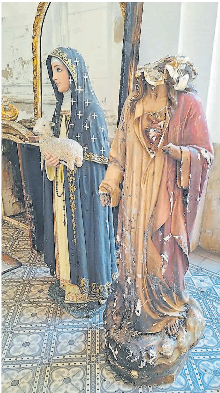
Imagen intacta. Santa Inés con el rosario junto al Sagrado Corazón.

La comparación entre los dos hechos avivó la idea de que santa Inés había protagonizado un milagro. El padre Gustavo Antico , pá-