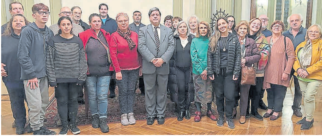
Docentes, catequistas y agentes pastorales. Los alumnos de la nueva edición que va de abril a noviembre.