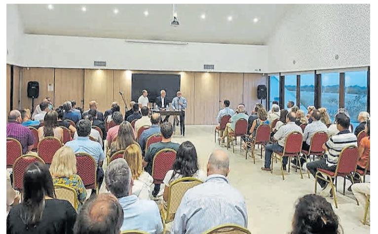
Vivencias. Empresarios católicos y evangélicos durante el intercambio.

El Espacio de Diálogo Interreligioso -una iniciativa de la Fundación Grupo Sancor Seguros- se inauguró el 27 de marzo de 2022.