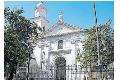
Fachada. Un lugar con historia.

Un templo inaugurado en 1745 que es Monumento Histórico Nacional