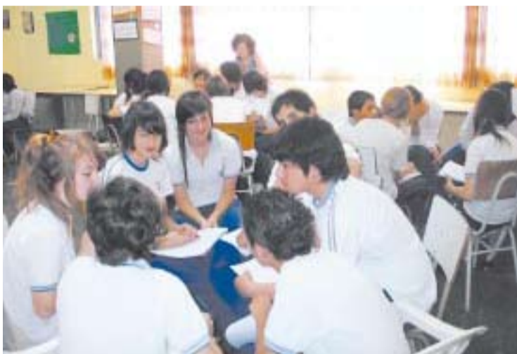
AGENDA. EL PROGRAMA "WALLENBERG EN LA ESCUELA" ESTA EN LAS AULAS.