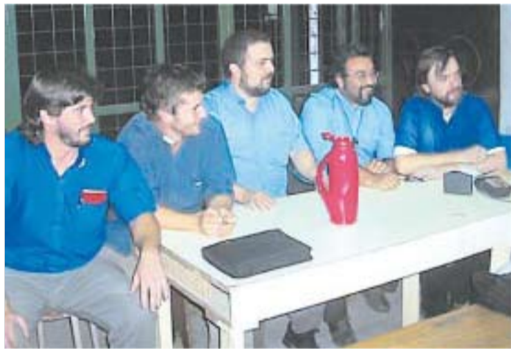
MANO A MANO. LOS CURAS VILLEROS EN LA CHARLA CON VALORES RELIGIOSOS.

-Di Paola: Si bien desde nuestra época de seminaristas la leímos y analizamos bastante, nos nutrimos fundamentalmente con la teología que tiene que ver con la religiosidad del pueblo que, a su