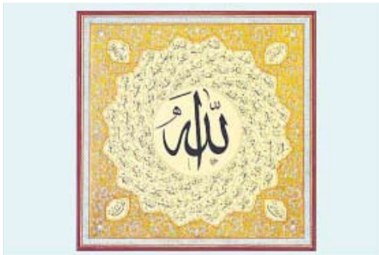
SEÑOR ABSOLUTO. DIOS NO HA ENGENDRADO NI HA SIDO ENGENDRADO.

Los coetáneos del profeta Muhammad le preguntaron acerca de