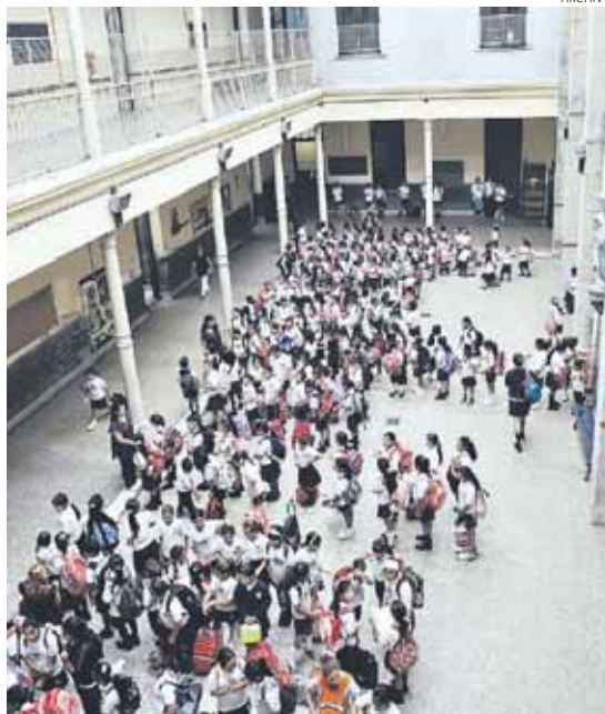
PREOCUPACION. LAS DROGAS SE VENDEN EN LA CERCANIA DE LOS COLEGIOS.