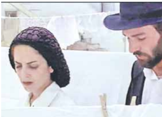
UN DESAFÍO. FILMAR LOS DILEMAS QUE AFRONTAN LOS JUDÍOS ORTODOXOS.

Es que para las comunidades ortodoxas, el uso de imágenes es complejo. Hay muchas que viven aisladas de la sociedad en general, que no ven televisión ni cine y sólo leen periódicos especiales.